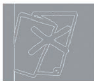
Mangelhafte Verarbeitung Falten, Eselsohren