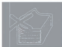
Papier zu dünn – Klammerung trägt auf